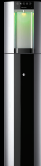
Zilver – Vloeropstelling