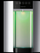
Zilver – Aanrechtmodel