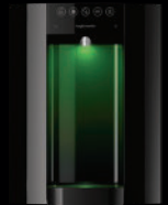
Zwart – Aanrechtmodel