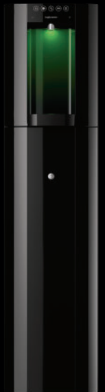
Zwart – Vloeropstelling