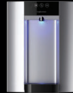
Zilver – Aanrechtmodel