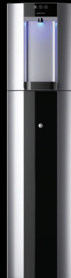
Zilver – Vloeropstelling