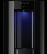
Zwart – Aanrechtmodel