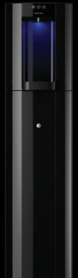
Zwart – Vloeropstelling