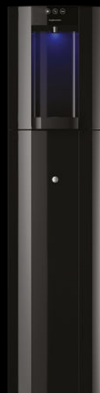
Noir - Colonne