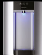
Gris métallisé - Comptoir

Contient un filtre à charbon et les pièces requises pour une installation facile.