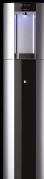
Gris métallisé - Colonne