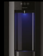
Noir - Comptoir